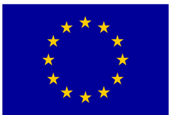
Euroopa Liit Euroopa Sotsiaalfond